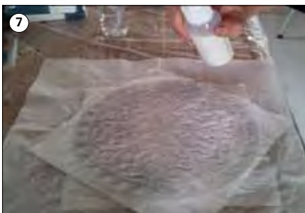
⑦ Mit Lack Nr. 2188 besprühen, bevor das Relief von der Form entfernt wird.