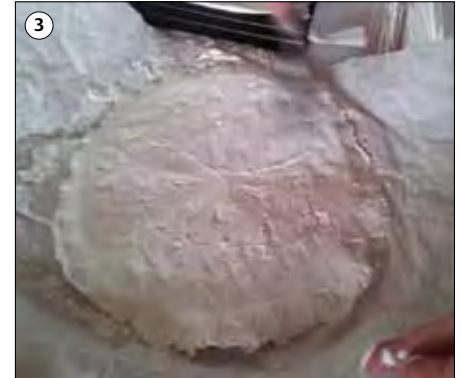
Schmieren Sie eine dicke Schicht der Relief Base auf die Rückseite des Papierreliefs.