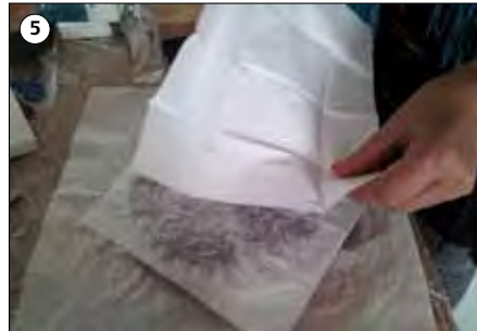
⑤ Den Prozess mit 2 weiteren Schichten wiederholen. 3 Schichten Servietten.