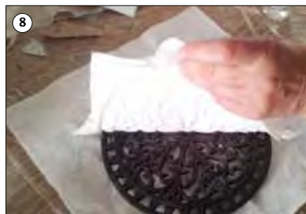
⑧ Nehmen Sie vorsichtig das Relief von der Form ab.