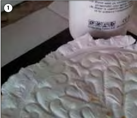
Das Papierrelief wird mit dem Relief Base aufgeklebt.