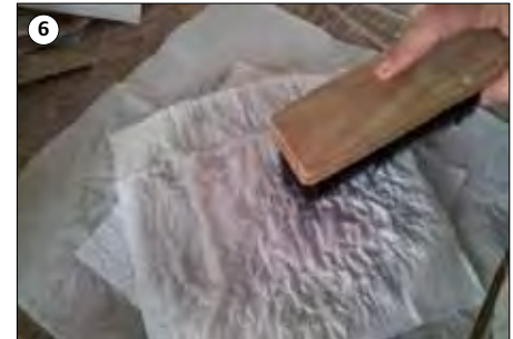
⑥ Gründlich mit einer Bürste auf die letzte Schicht klopfen.