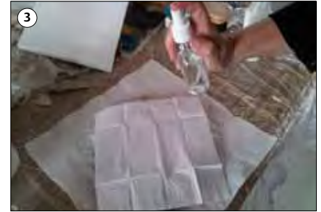
③ Die Serviette mit Wasser besprühen.