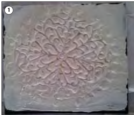
Das Buch mit dem Relief ist bereit für die Patinierung.