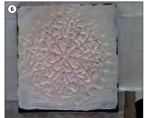
Integrieren Sie das Papierrelief, indem Sie die Relief Base rundherum auftragen.

Für die Patinierung – Siehe nächste Seite.