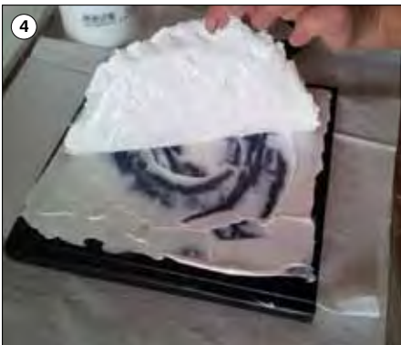
Kleben Sie das Relief auf das Werkstück.