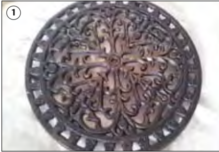
① Finden Sie eine geeignete Form. In diesem Beispiel ein Untersetzer aus Gusseisen.