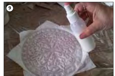
⑨ Drehen Sie das Relief um = rechte Seite. Nochmals mit Relief Medium besprühen. Das Relief trocknen lassen.

Das fertige Relief muss nun vollständig trocknen. Um das Relief flach zu behalten, eventuell etwas Druck anbringen.