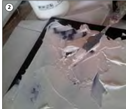
Start: Schmieren Sie eine dicke Schicht der Relief Base auf das Werkstück.