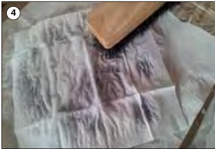
④ Vorsichtig mit einer Bürste darauf klopfen.