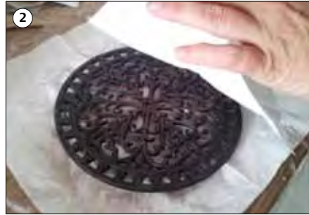
② 1. Schicht – die Papierserviette auf die Form legen.