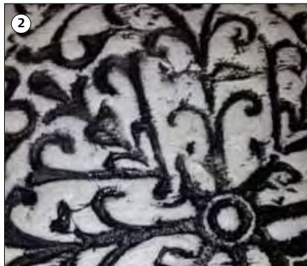
Beginnen Sie damit das schwarze Acryl Satin aufzutragen. Trocknen Sie die schwarze Farbe mit einem Lappen an der Oberfläche ab.