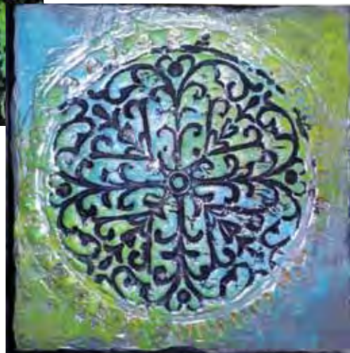
Das fertige Buch mit Relief und Patinierung.