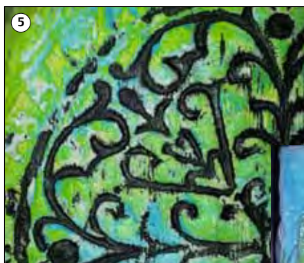
Nahaufnahme des patinierten Reliefs. Am Schluss eventuelle blanken Lack Nr. 5390 auftragen.