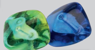
PERLEN MIT BESONDEREN FORMEN