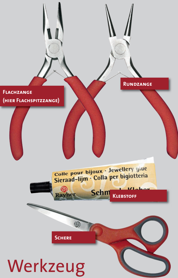
FLACHZANGE (HIER FLACHSPITZZANGE)

METALLPERLEN UND ZWISCHENTEILE | sind in großer Auswahl erhältlich