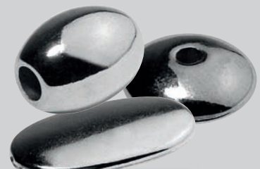
METALLPERLEN UND ZWISCHENTEILE