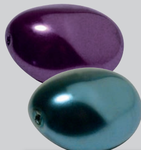
PERLEN MIT BESONDEREN FORMEN